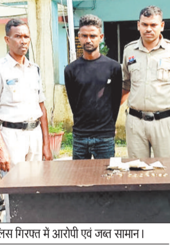
पुलिस गिरफ्त में आरोपी एवं जप्त सामान।

हरदीबाजार थाना क्षेत्र में लगातार तीन महिलाओं से मंगलसूत्र लूटने वाले गिरोह का पर्दाफाश करते हुए एक आरोपी और उसके द्वारा लूटे