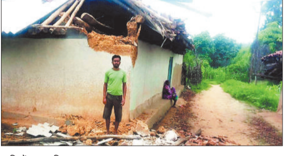
हाथियों द्वारा क्षतिग्रस्त मकान।